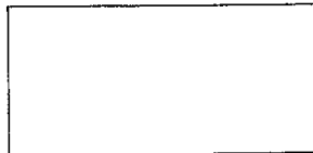
图 1 图名称